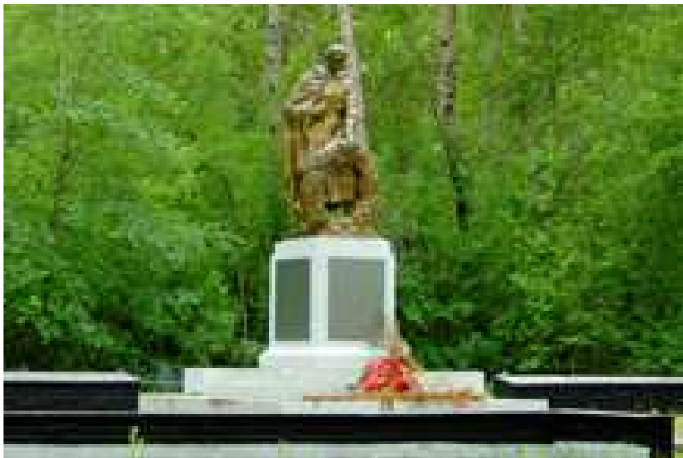
Рис. 1 Памятник-скульптура «Воин с венком» (1984 год)

Авторы : Скульптор – Ф.М. Бондарь, архитектор – А.Ю. Клейн.