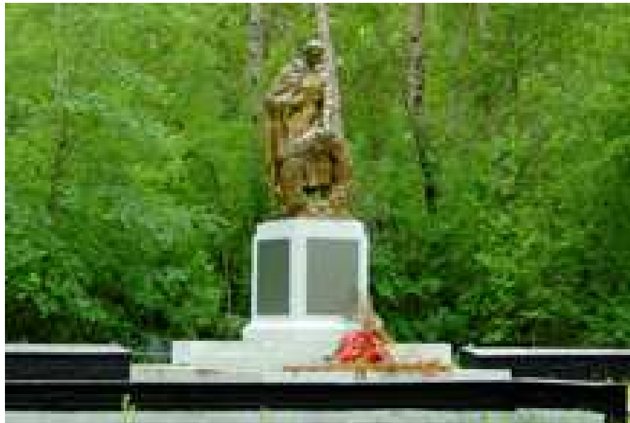
Рис. 1 Памятник-скульптура «Воин с венком» (1984 год)

Материал: светлый бетон с наполнителем из мелкой мраморной крошки. Внутри скульптура пустотелая с металлическим каркасом.